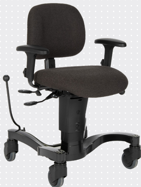
VELA Tango 700