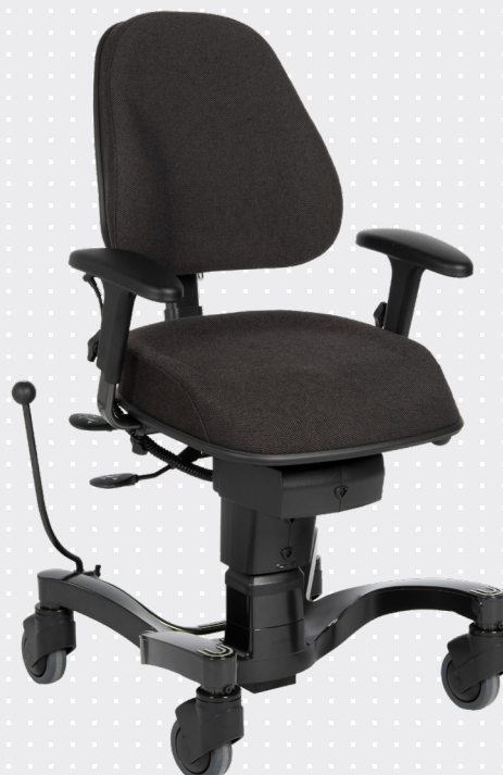
VELA Tango 700E